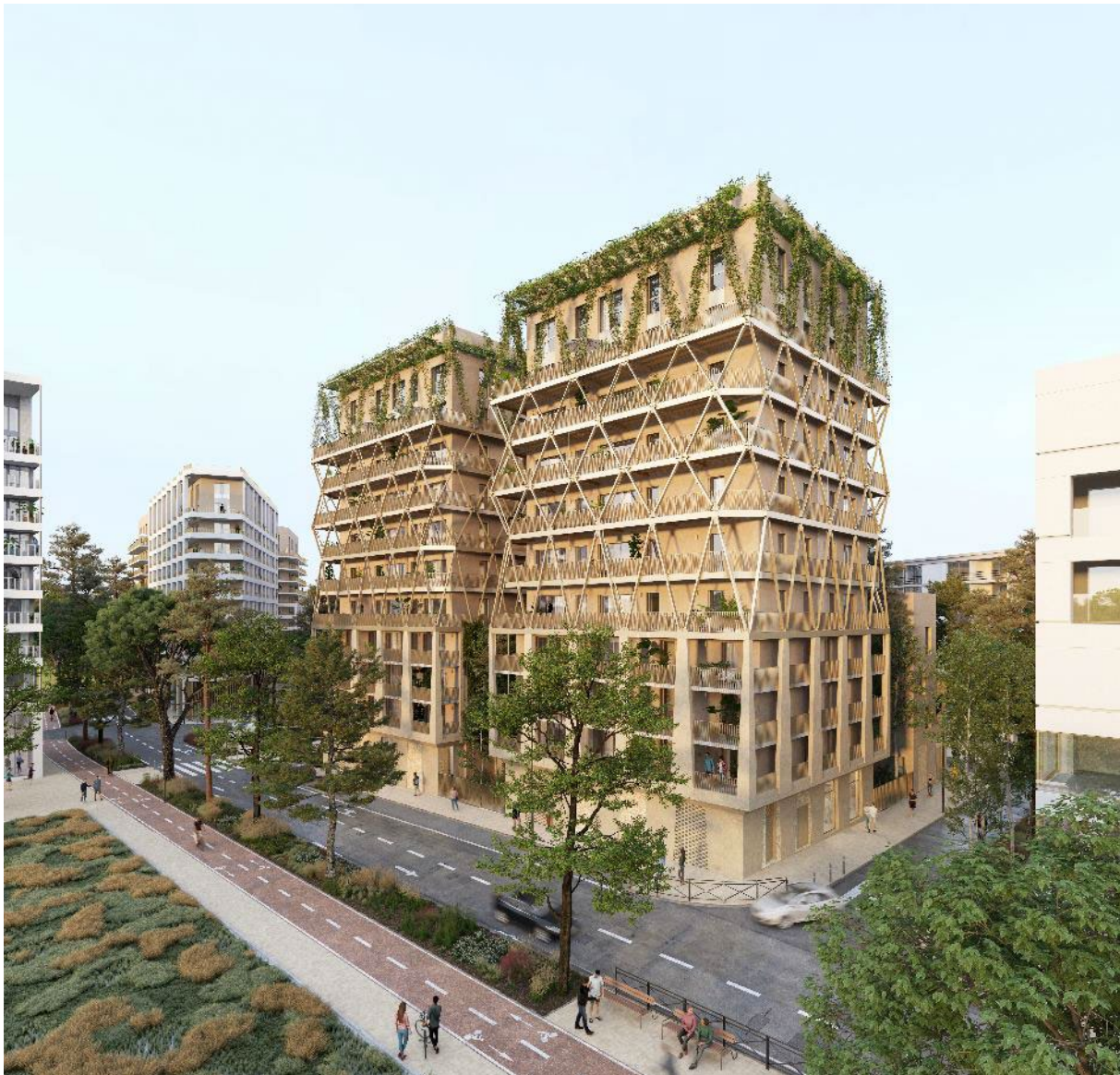
Perspective du projet IKSSO à Bordeaux

Sur la résidence IKSSO, à Bordeaux composée de 94 logements, le système StoVentec R Enduits, sera mise en œuvre sur les façades à ossature bois préfabriquées, de deux des quatre bâtiments que comprend le projet.